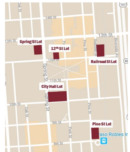
Figura 2. Ubicaciones de estacionamiento para Empleados con Permisos

El mapa de la derecha muestra las áreas de estacionamiento en el centro de Paso Robles para empleados que obtuvieron un permiso del